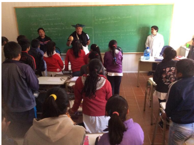
Visita a outra escola. 60 minutos de diálogos numa sala do primário.