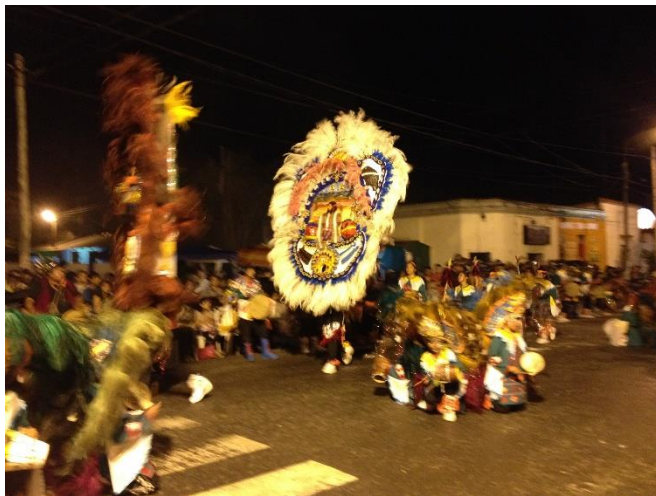
Foto em Salta sobre o Rio Branco.

Conhecemos o CARNAVAL CULTURAL DE SALTA, onde os blocos apresentam, em sua maioria, as cosmovisões dos diferentes povos indígenas locais.