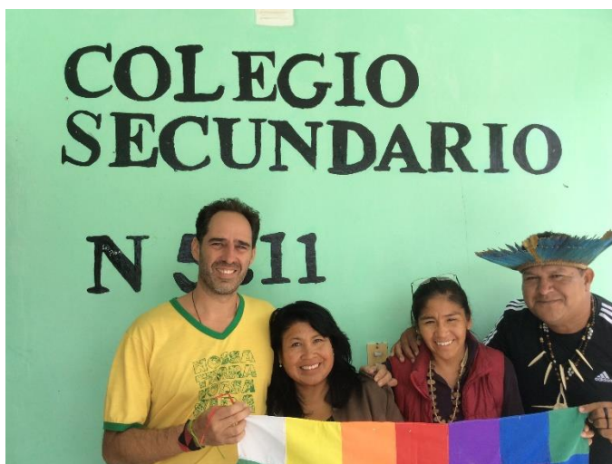
Visita a uma quarta instituição de ensino; no caso para dialogar com a Diretora e a Secretaria Administrativa sobre a lei brasileira 11.645/2008